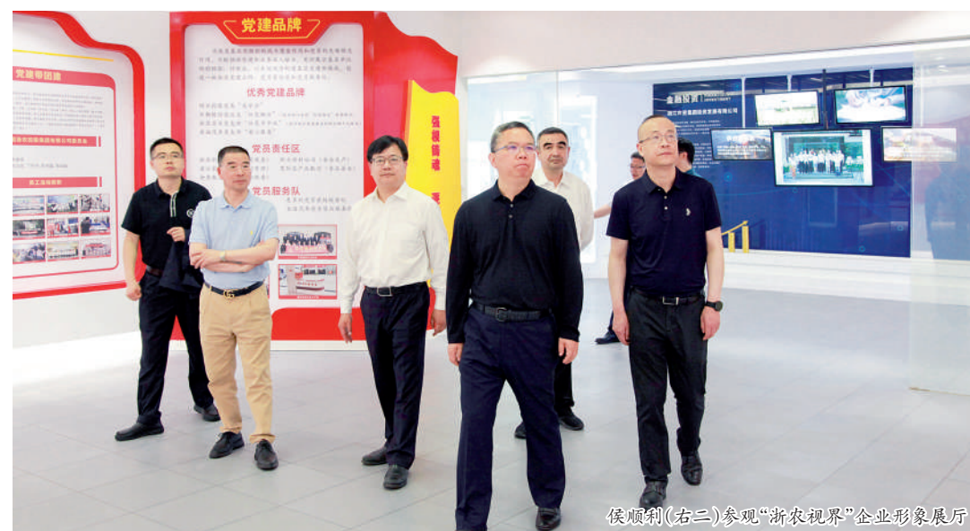
侯顺利(右三)参观“浙农视界”企业形象展厅

在实地参观浙农科创园、“浙农视界”企业形象展厅后,侯顺利听取了浙江省供销社党委委员、理事会副主任沈省文、浙农控股集团党委书记、董事长李文华及浙农茂园有关负责人作的为农服务、社企发展等汇报,对浙江省供销社在“三农”、推动改革、加快社企发展等方面的成果给予充分肯定。他指出,浙江省供销社围绕习近平总书记亲自命题的“三位一体”改革任务,聚焦为农服务重点领域,通过社有企业这一重要抓手,持续推动农村流通体系建设和为农服务能力提升,为推进乡村振兴和农业农村现代化做了很多卓有成效的工作。浙农控股集团作为供销社系统的龙头企业,坚持“在社大中为农服务,在为农服务中社大”,通过改革创新走上高质量发展之路,有关经验值得很好总结和推广。